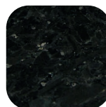
42-4832-07 Cambrian black