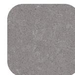
52-6036-HRU609 Uptown Grey