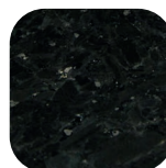
42-6036-07 Cambrian black