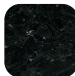
43-3636-07 Cambrian black