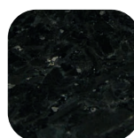
43-4832-07 Cambrian black